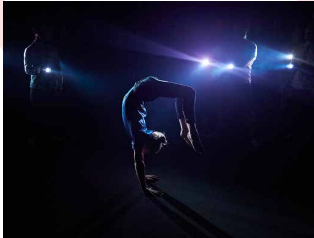
Cirque Noël in Graz: die Künstlergruppe Gravity & Other Myths