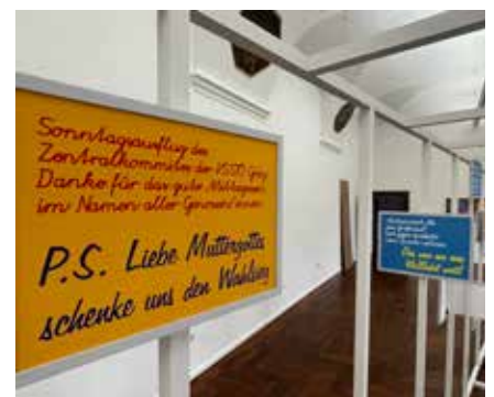
(Glaubens-)Propaganda in der „kultum“-Ausstellung: Subtiles von der Künstler*in-Gruppe zweintopf

Kuratorenführungen und eine ganz besondere Finissage inklusive „Selbstkritik“ am 13.1.2023 locken zusätzlich zu diesem einzigartigen Ausstellungserlebnis, das bis 14.1.2023 besucht werden kann (siehe bitte www.kultum.at ).